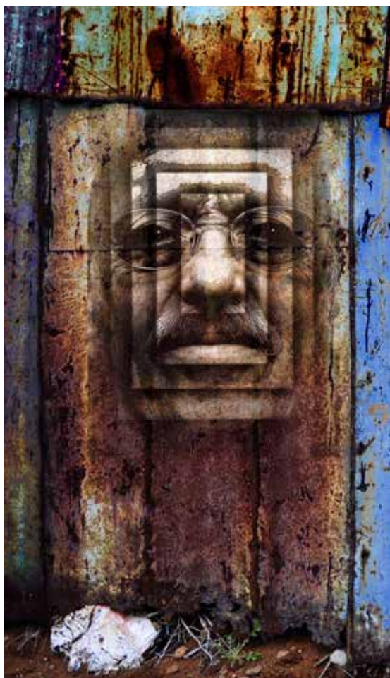
"Udfoldet bliktonde" Selvportræt af Jørn Birkeholm